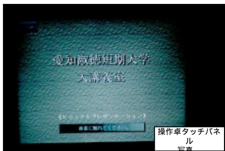
操作卓タッチパネル 写真